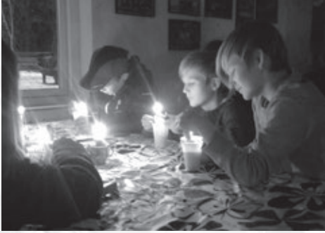
Krudtugle aften i klubhus uden strøm